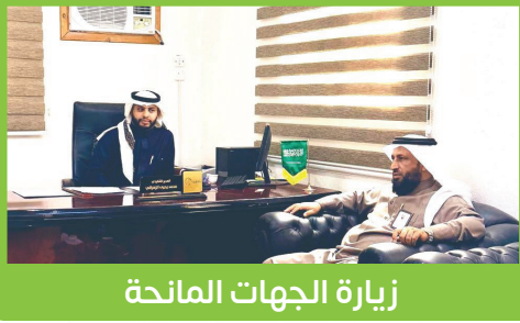
زيارة الجهات المانحة