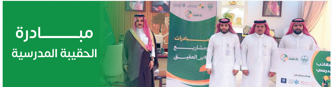
مبادرة الحقيبة المدرسية