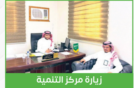
زيارة مركز التنمية