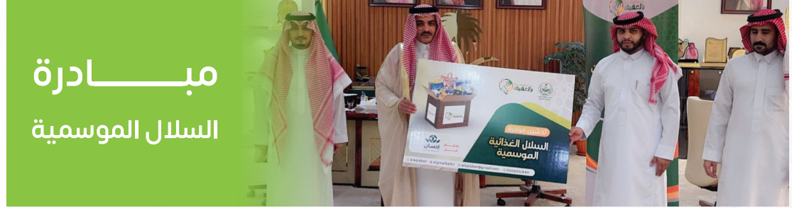
مبادرة السلال الموسمية